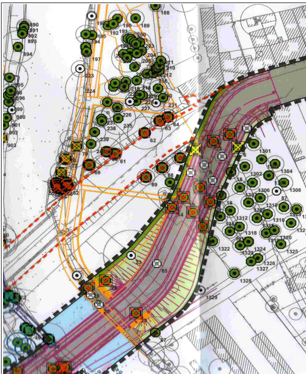
B-Plan 54, Beschluss vom 05.02.2007

Am 06.02.2007 wurde eine Karte erstellt, die deutlich über die Darstellungen des B-Planes vom Vortag hinaus Bäume zur Fällung vorsieht (siehe rechter Kartenausschnitt unten). Auf Basis dieser Karte wurden am 08.02.2007 von der Verwaltung bei der Unteren Naturschutzbehörde Fällgenehmigungen beantragt.